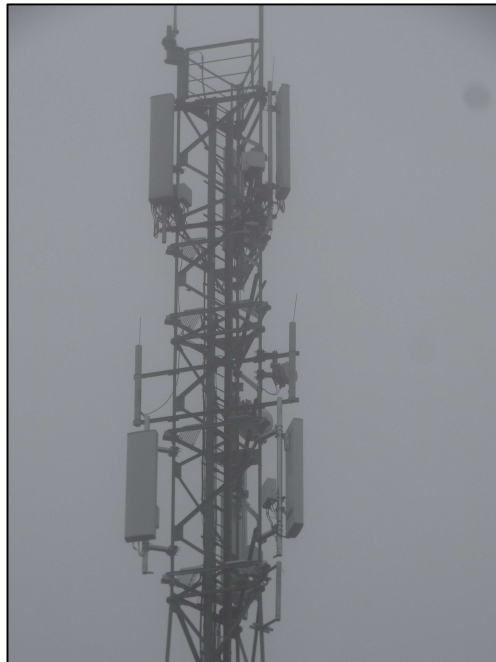
Rys. 3 Widok badanego obiektu